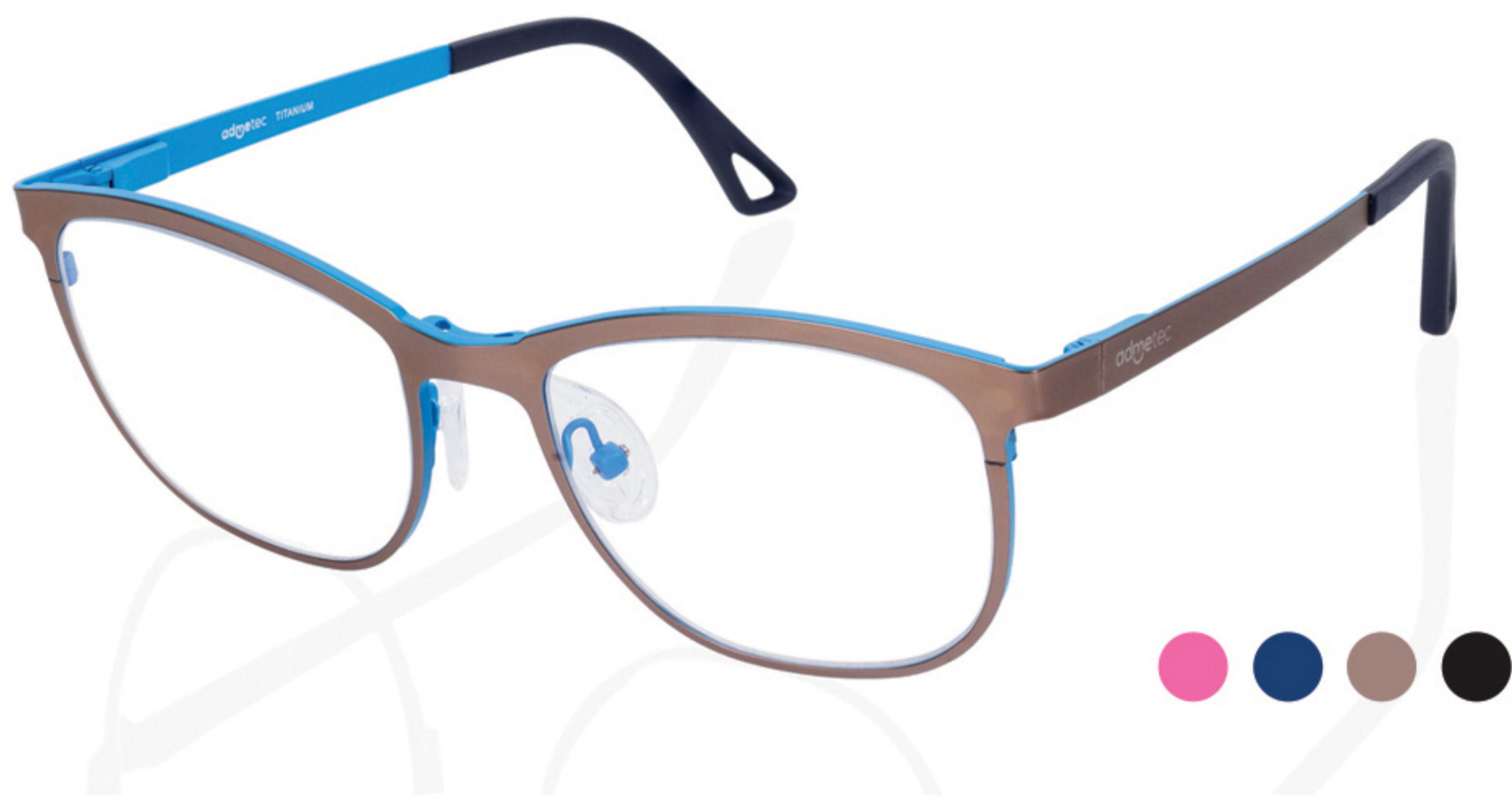
BLUES | Mis. M - L