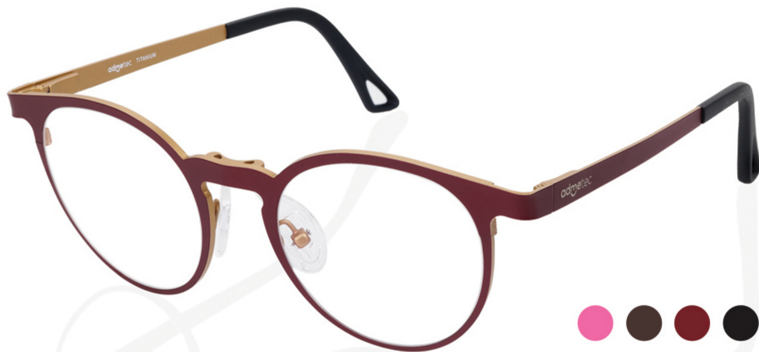
SOUL | Mis. M - L